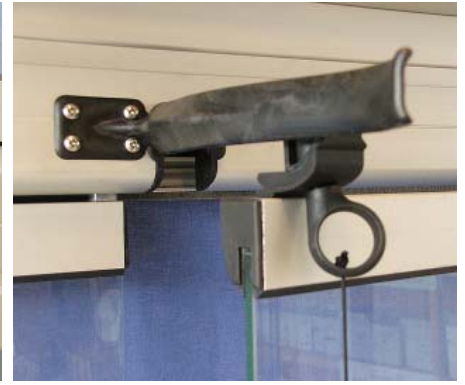
Övre lås med snöre