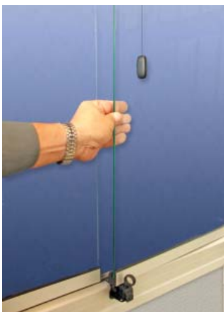
Öppningsglas i vädringsläge